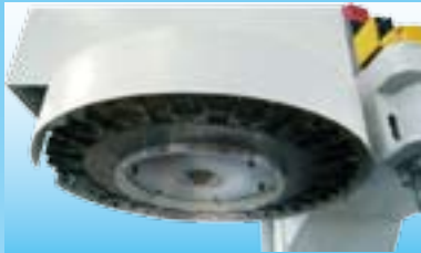
Магазин на 24 инструмента